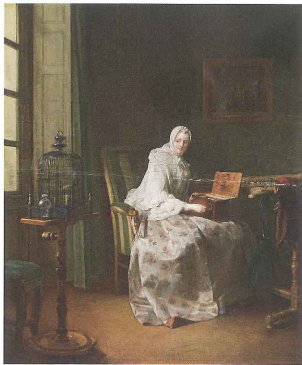
ジャン・シメオン・シャルダン《セリネット(鳥籠琴)》1751-1753年 油彩、画布 50.8×43.2cm ニューヨーク、フリック・コレクション蔵