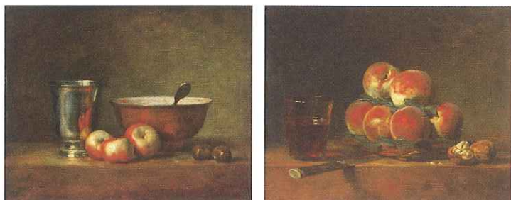
左：ジャン・シメオン・シャルダン《銀のゴブレットとりんご》1768年頃 油彩、画布 33×41cm パリ、ルーヴル美術館蔵 ©RMN-GP (Musée du Louvre) / Stéphane Maréchal / distributed by AMF-DNPartcom 右：ジャン・シメオン・シャルダン《桃の籠》1768年 油彩、画布 32.5×39.0cm パリ、ルーヴル美術館蔵 ©RMN-GP (Musée du Louvre) / Stéphane Maréchal / distributed by AMF-DNPartcom