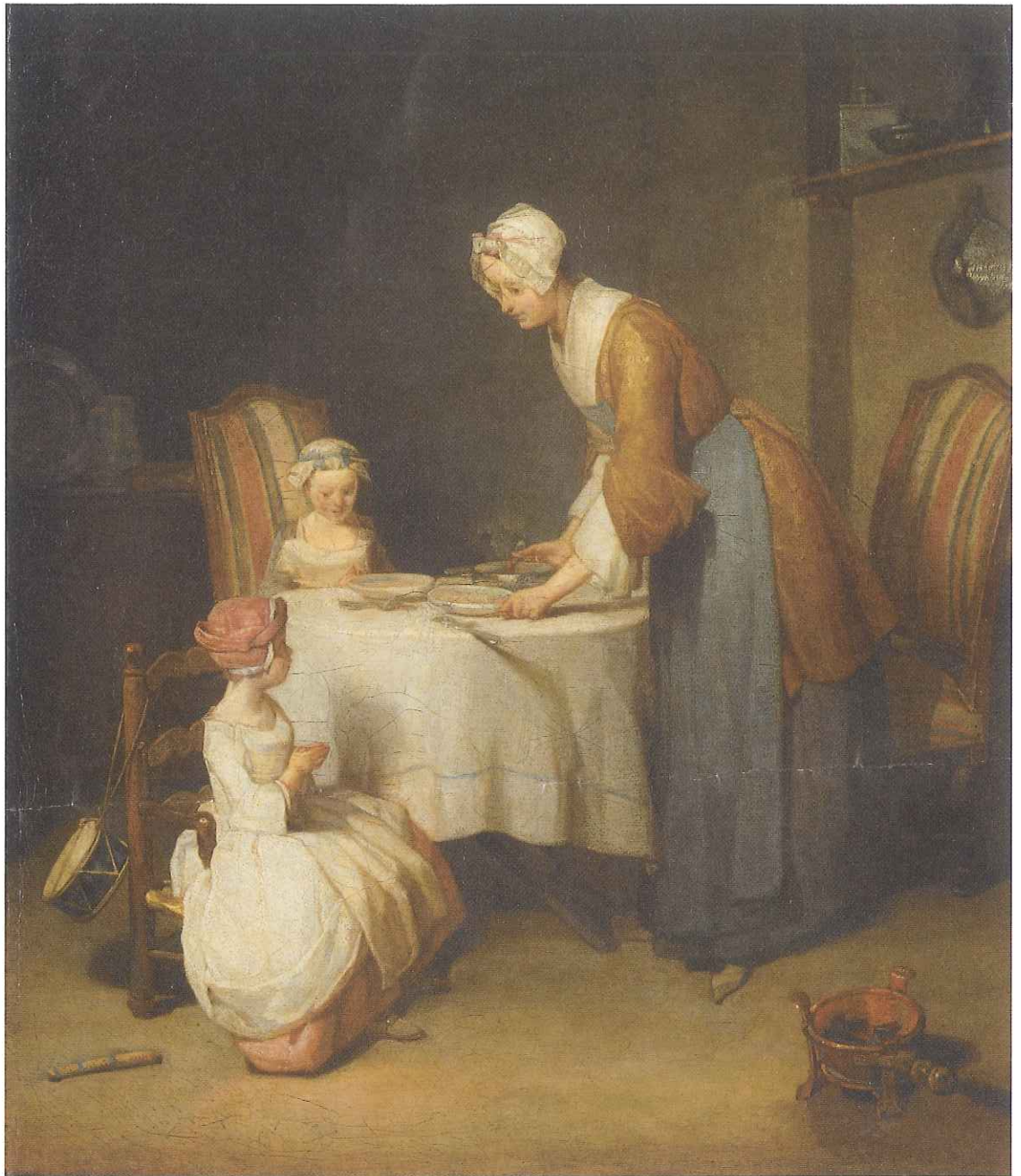
ジャン・シメオン・シャルダン(食前の祈り)(部分)1740年頃 油彩、帆布 49.5×41cm パリ、ルーヴル美術館蔵